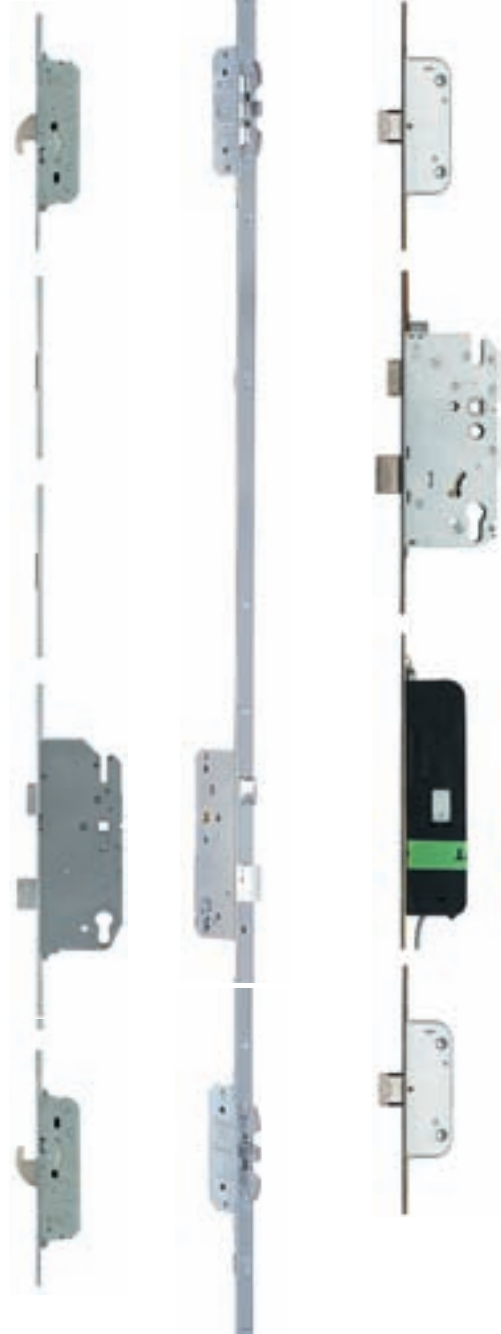
Kanca sürgülü boy kilitler